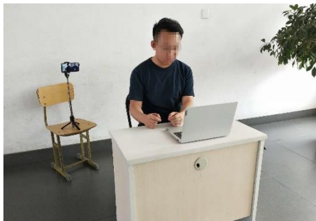
图 1 考生双机位设备摆放布置示意图

双机位拍摄画面显示完整的考生考核环境，即双机位两台设备同时开启摄像头，第一机位（电脑）摄像头对准考生本人从正面拍摄（要保证第二机位手机屏幕能被考核专家看到），第二机位（手机）摄像头从考生侧后方 45° 拍摄（要保证考生第一机位电脑屏幕能被考核专家组看到，建议使用手机支架，保持第二机位稳定拍摄），考生双机位设备摆放布置示意图如图 1 所示。