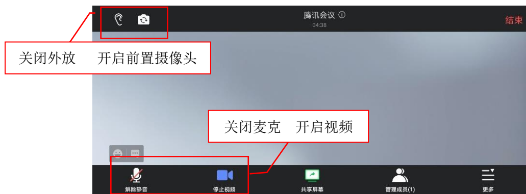
图2 腾讯会议第二机位设置图

第二机位采用手机的，开启手机屏幕“自动转转”功能，手机横屏拍摄。腾讯会议相关设置结果如图2所示。