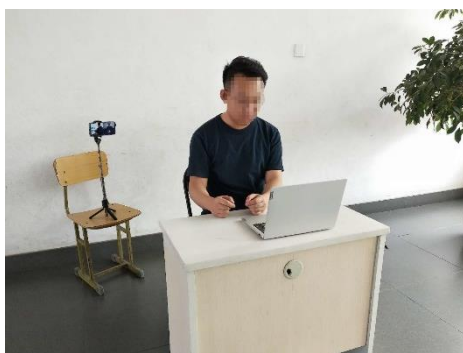
图 1 考生双机位设备摆放布置示意图

双机位拍摄画面显示完整的考生复试环境，即双机位两台设备同时开启摄像头，第一机位（电脑）摄像头对准考生本人从正面拍摄（要保证第二机位手机屏幕能被复试专家看到），第二机位（手机）摄像头从考生侧后方 45° 拍摄（要保证考生第一机位电脑屏幕能被复试专家组看到），考生双机位设备摆放布置示意图如图 1 所示。